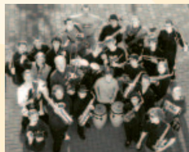
Burning Big Band

Nicht mehr wegzudenken aus der Soester Jazzszene ist das »Burning Big Band Project« der Musikschule Soest, das mit seinem breit gefächerten Repertoire konzertant-anspruchsvolle Glanzlichter setzt. In vielen Arrangements wird zusätzlicher Raum für ausgiebige Soloimprovisationen geschaffen, so dass sich auch die künstlerische Freiheit der Solisten im kreativen Zusammenspiel mit den Musikern der Rhythmsection voll entfalten kann.