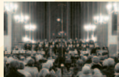
Chor des Städtischen Musikvereins

Neben Motetten von Johann Sebastian Bach und Heinrich Schütz steht als Hauptwerk des Chorkonzerts das »Oratorio de Noël« von Camille Saint-Saëns auf dem Programm. In diesem Oratorium beschreibt der junge Saint-Saëns das Weihnachtsgeschehen in schlichter, aber sehr eindringlicher Weise unter Einsatz einer aparten Besetzung von Streichern, Harfe, Orgel, vier Solisten und Chor.