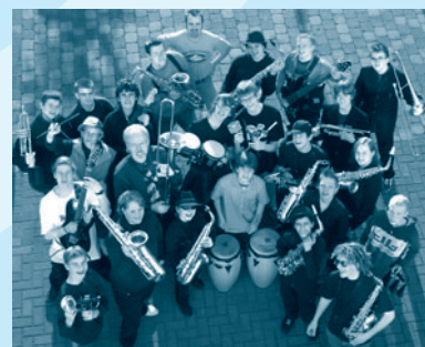
»Burning Big Band Project«