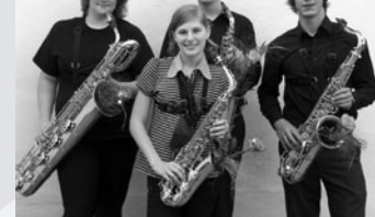
»Fo(u)r after eight«