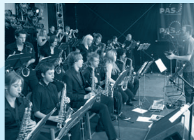
»Burning Big Band Project«