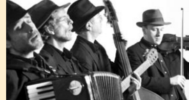
»Das Blaue Einhorn«

Den abschließenden Höhepunkt der Weltmusiknacht bildet der Auftritt des Dresdner Folk-Ensembles »Das Blaue Einhorn«.