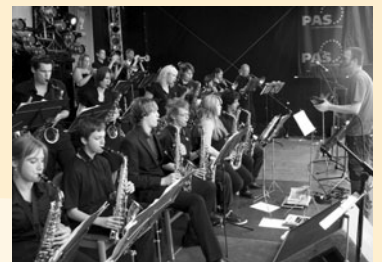
Burning Big Band Project live