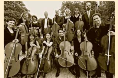
Die 12 Hellweger Cellisten

Das Cello spricht zu uns in unserer eigenen Tonlage und kann dabei das Bedürfnis nach ausschweifender Kantilene ebenso befriedigen wie das nach sattem Fundament, es kann rhythmisch prägnante, schroffe, jazzige Akzente setzen oder sich in einem Universum ätherischer Klangmalerei verlieren – alles klingt überzeugend und original. Das von der Stadt Soest geförderte Konzert findet in Kooperation mit dem Festival »Celloherbst am Hellweg« und der Kulturhauptstadt RUHR.2010 statt.