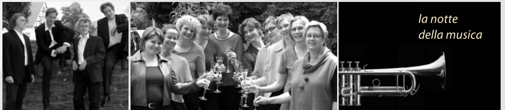
Soester Madrigal Syndikat, Frauenchor »Frizzante« und viele weitere Mitwirkende bei »La Nocte della musica«

Angeregt durch die legendären »Proms«, die traditionelle Sommerkonzertreihe in London und deren berühmte Abschlussveranstaltung im Herbst, der »Last Night of the Proms« (auch in Deutschland im TV übertragen) mit der abschließenden, inoffiziellen englischen Nationalhymne »Pomp and Circumstances« von Edward Elgar, hat sich ein kleiner Kreis von Musikern und musikbegeisterten Menschen zusammengefunden, um etwas ähnliches auch für Soest zu entwickeln. Dabei herausgekommen ist »La notte della musica«, eine Veranstaltung mit einem unterhaltsamen und anspruchsvoll moderierten Klassikprogramm mit vielen vertrauten Hits der sogenannten »E-Musik«.