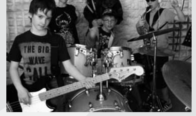
Little Big Noise Band