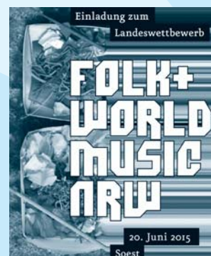
Landeswettbewerb in Soest

Bedingt durch die enorme Zuwanderung ausländischer Mitbürger im vergangenen Jahrhundert haben sich nicht nur in den Ballungsräumen von Nordrhein-Westfalen eine Vielzahl musikalischer Spiel- und Hörgewohnheiten etabliert. Das Projekt »Folk+World Music NRW« mit Wettbewerben und Workshops soll Kindern und Jugendlichen aller Nationalitäten ein Podium für »ihre« Musik bieten. Dabei findet traditionelles westfälisches Liedgut genauso seinen Platz wie internationale Folkmusik und »Weltmusik«. Durch verstärkte Einbeziehung ausländischer Gruppen aus der freien Musikszene in NRW möchte das Projekt im gemeinsamen Musizieren und einander Zuhören einen Beitrag für gegenseitige Toleranz und Akzeptanz im Umgang mit Fremden und deren Kultur leisten. Teilnehmer des diesjährigen Wettbewerbs treten noch am gleichen Tag im Rahmen des »PopUps« Festivals auf dem Soester Marktplatz auf.