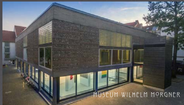
MUSEUM WILHELM MORGNER