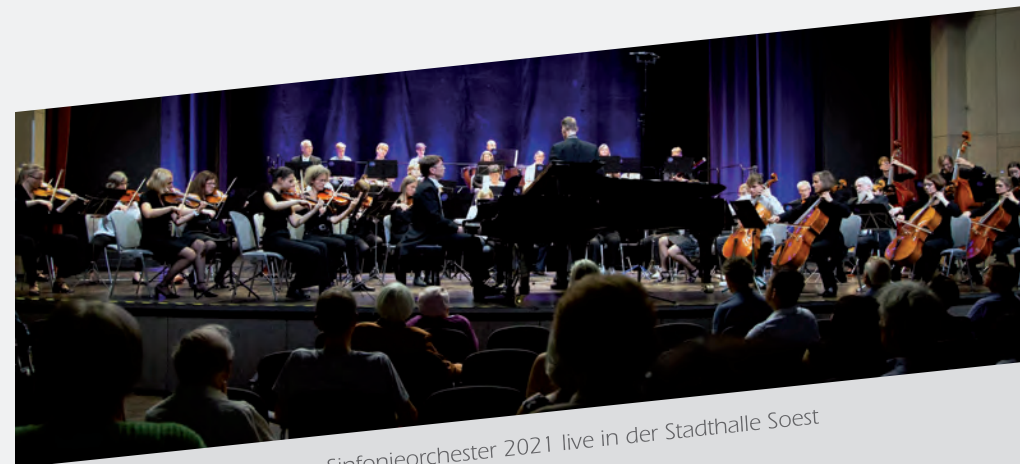
Sinfonieorchester 2021 live in der Stadthalle Soest

Aktuelle Projektbesetzung Bläser und Streicher ►