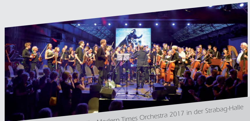
Legendär: Modern Times Orchestra 2017 in der Strabag-Halle

Hans Zimmer arbeitete in den frühen 1980er Jahren als Assistent des britischen Filmmusik-Komponisten Stanley Myers in den Londoner »Air-Edel-Studios«. Durch diese Zusammenarbeit erhielt er erste kleinere Aufträge für eigene Filmmusikprojekte. 1988 machte er mit der Musik zu »Rain Man«, für die er auch seine erste Oscar-Nominierung erhielt, international auf sich aufmerksam. 1995 wurde er für die Filmmusik zu »Der König der Löwen« auch tatsächlich mit einem Oscar ausgezeichnet. Heute gilt Zimmer als einer der einflussreichsten Filmkomponisten der Gegenwart. In seiner Produktionsfirma »Media Ventures« in Hollywood werden jedes Jahr Dutzende Soundtracks zu TV-Serien, Filmen und Events produziert. Auch die Scores zu »Mission: Impossible II«, »King Arthur«, »Madagascar«, »The Da Vinci Code«, »Inception« und »Dunkirk« – um nur einige wenige zu nennen – entstammen seiner Feder. Der Grammy Award 2009 für das bestkomponierte Soundtrack-Album für Film, Fernsehen oder visuelle Medien ging für »The Dark Knight« an Hans Zimmer und James Newton Howard. ▶ Seite 14