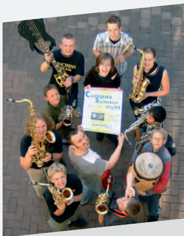
First steps mit der Big Band: So begann es vor 20 Jahren...