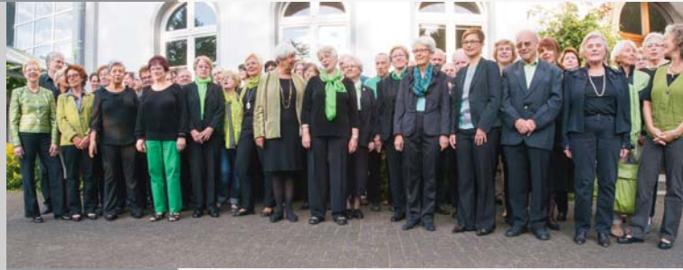
CHOR DES MUSIKVEREINS

berührenden Gesangssoli und jubelnden Chören im Wechsel hat schon im Erstaufführungsjahr 1840 das Publikum begeistert und zählt heute zum Kanon der klassischen Musik.